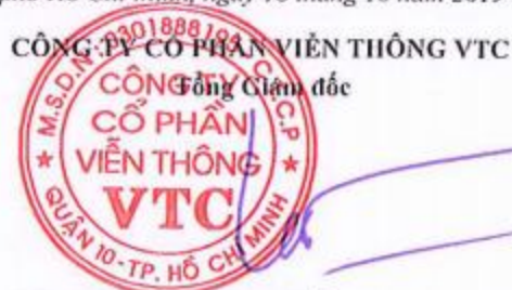
Lê Xuân Tiến

Các thuyết minh từ trang 7 đến trang 29 là bộ phận hợp thành của Báo cáo tài chính này.