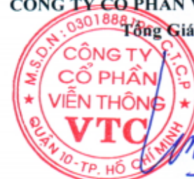
Lê Xuân Tiến

Các thuyết minh từ trang 7 đến trang 29 là bộ phận hợp thành của Báo cáo tài chính này.