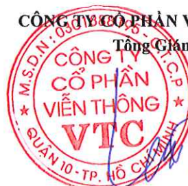
Lê Xuân Tiến

Các thuyết minh từ trang 7 đến trang 29 là bộ phận hợp thành của Báo cáo tài chính này.