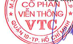
Lê Xuân Tiến

Các thuyết minh từ trang 7 đến trang 29 là bộ phận hợp thành của Báo cáo tài chính này.