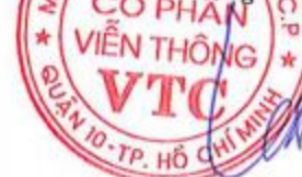
LÊ XUÂN TIẾN